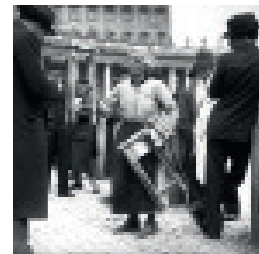
sopra | finto matrimonio in tandem a piazza San Pietro, settembre 1939